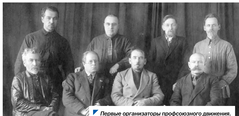
Первые организаторы профсоюзного движения.

После февральской революции 1917 года в Челябинске массово стали возникать профессиональные союзы рабочих и служащих. Уже к лету 1917 года профсоюзы Челябинска объединяли свыше 3,5 тыс. человек. Свои союзы создали печатники, чае-развесочники, рабочие и служащие городской продовольственной управы, угольных копеей, промышленных предприятий, ломовые и легковые извозчики; появились профсоюзы официантов и поваров, портных, даже домработниц. Пожалуй, самыми грамотными и политически активными оказались работники типографий, мельниц, промышленных предприятий. Так, труженики печати летом 1917 года предъявили требования к работодателям об увеличении зарплаты и улучшении условий труда. Выступали со своими требованиями в газетах. Но хозяева лишь двух типографий согласились с доводами работников. 2 октября 1917 года печатники объявили забастовку с лозунгом: «Мы будем стойко бороться за защиту интересов рабочего класса и не отступать ни в коем случае ни шагу назад».