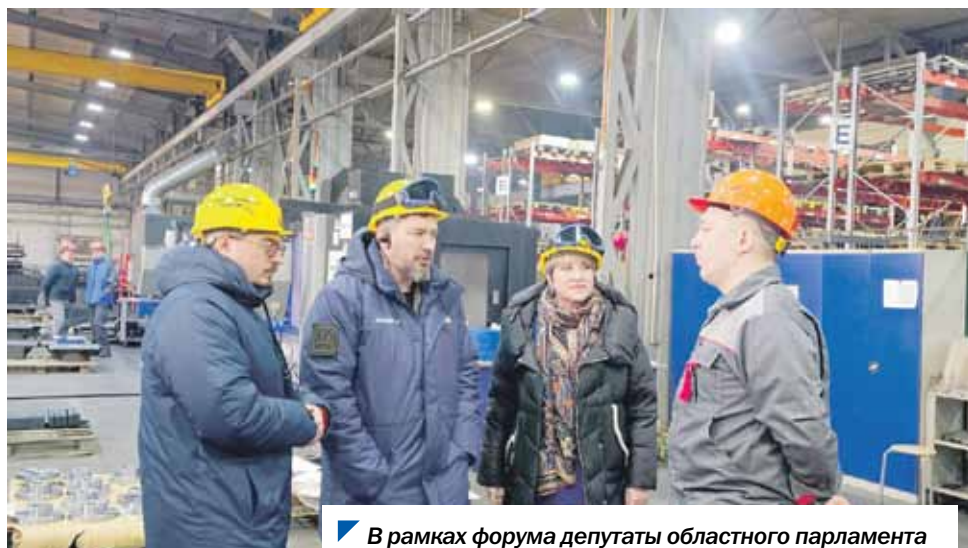
В рамках форума депутаты областного парламента посетили предприятие, где трудятся ветераны СВО.

В Челябинской области прошло важное событие не только для партийной жизни, но и для всего региона. Именно мы даем старт проведению таких форумов по всей стране. Это и признание результатов работы южноуральских партийцев, и честь, и большая ответственность.