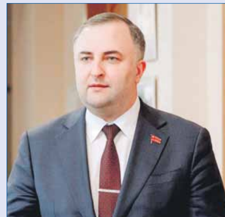
Олег ГЕРБЕР, председатель Законодательного Собрания Челябинской области: