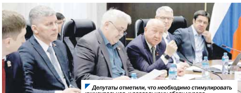
Депутаты отметили, что необходимо стимулировать южноуральцев к раздельному сбору мусора.

Также в ходе заседания депутаты отметили, что при проведении капремонтов в домах необходимо обеспечить соблюдение требований к качеству и срокам выполнения работ со стороны подрядных организаций.