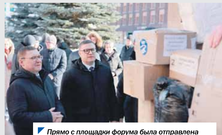
Прямо с площадки форума была отправлена очередная партия гуманитарной помощи в ДНР.