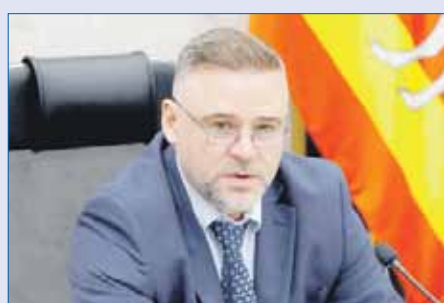
Вячеслав ЕВСТИГНЕЕВ, председатель комитета по аграрной политике и природопользованию:

При этом ситуация по инфраструктуре в кластерах неоднородная. Так, в Кыштымском кластере уже сегодня сортируется 100% образующихся отходов, 50% захоранивается, а остальное — перерабатывается, что и установлено