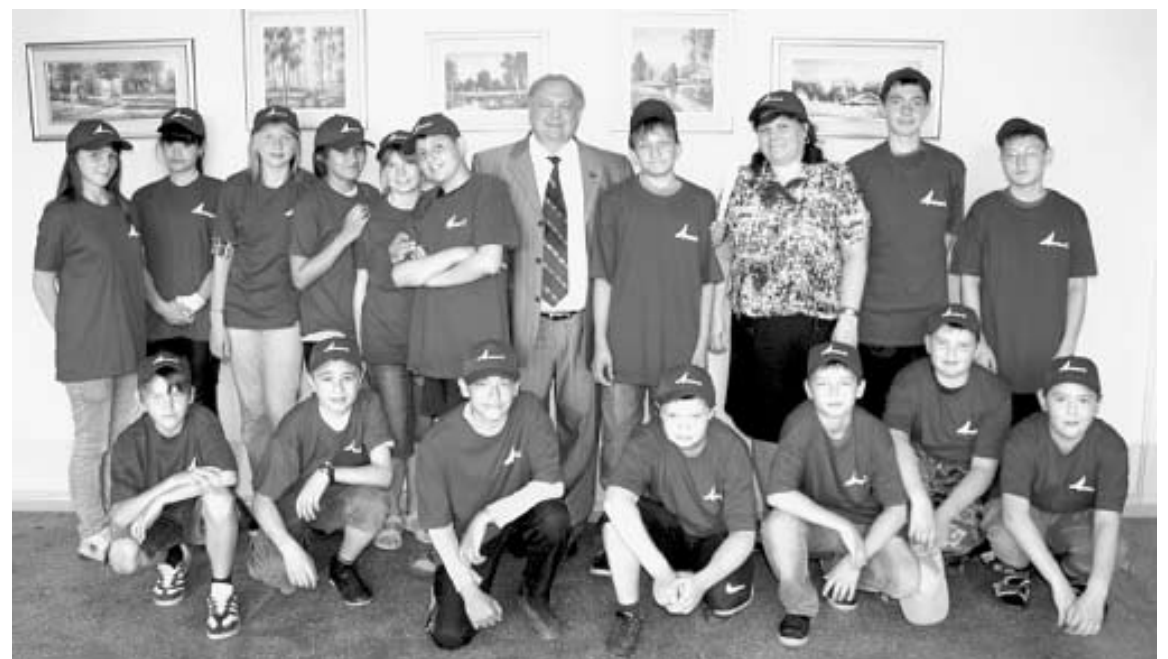
Вместе с депутатским отрядом в школе № 87

– Список добрых дел на следующий год уже составлен, – рассказал депутат. – Планов очень много, но придется исходить из своих финансовых возможностей. Постараемся проинвестировать ремонт кровли в школе № 87 и филиале лицея № 97. Требуется ремонт и спортивный зал детского сада № 440. В школе № 87 обустройства требует дворовая территория: надо будет поправить забор, отремонтировать асфальтовое покрытие, решить вопрос с освещением. Конечно, про-