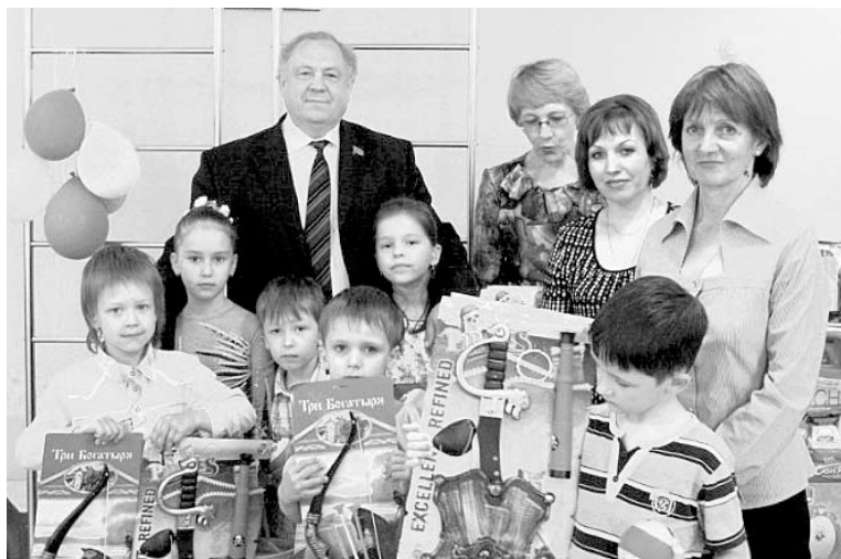
Депутат в детском саду № 263