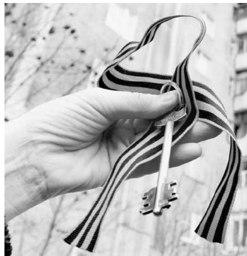
Одна из многих социальных статей – обеспечение жильем ветеранов Великой Отечественной войны

Напомним, в ноябре народные избранники утвердили проект бюджета на предстоящие три года в первом чтении. Как рассказал спикер об-