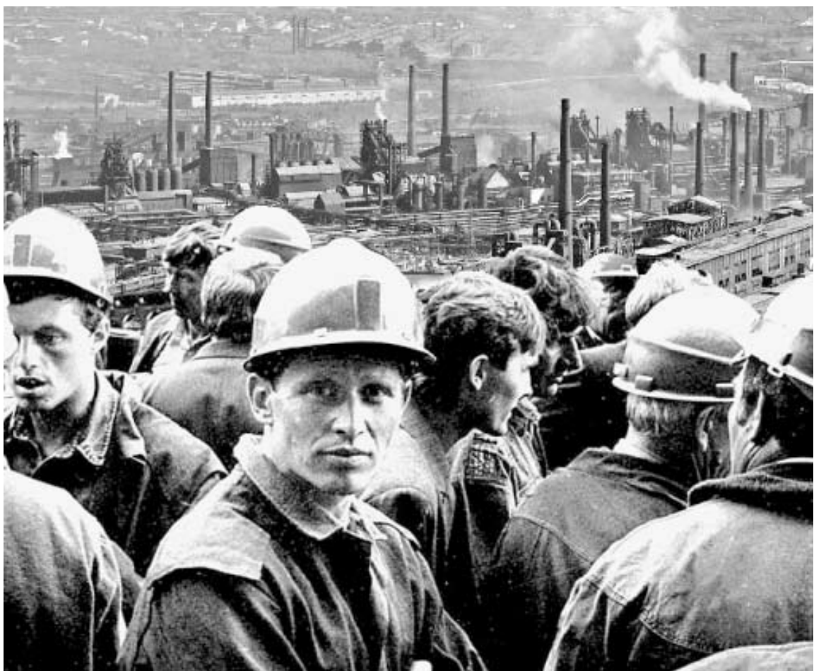
Коллаж Л. Мануриной

на челябинской станции. А народу тьма — пройти невозможно. Директор детдома, срывая голос, кричит: «Пропустите, умрут!» И толпа дала сначала трещину, потом образовался коридор. Пропустили детей. «И дали каждому по тарелке, не супа, — пишет Приставкин, — а жизни. Осознание, что такое люди, пришло здесь же».