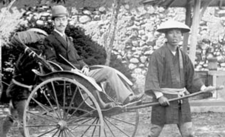
Так выглядел цесаревич Николай Александрович во время своего длительного восточного путешествия. Пребывание в Японии омрачилось террористическим актом против августейшего гостя.