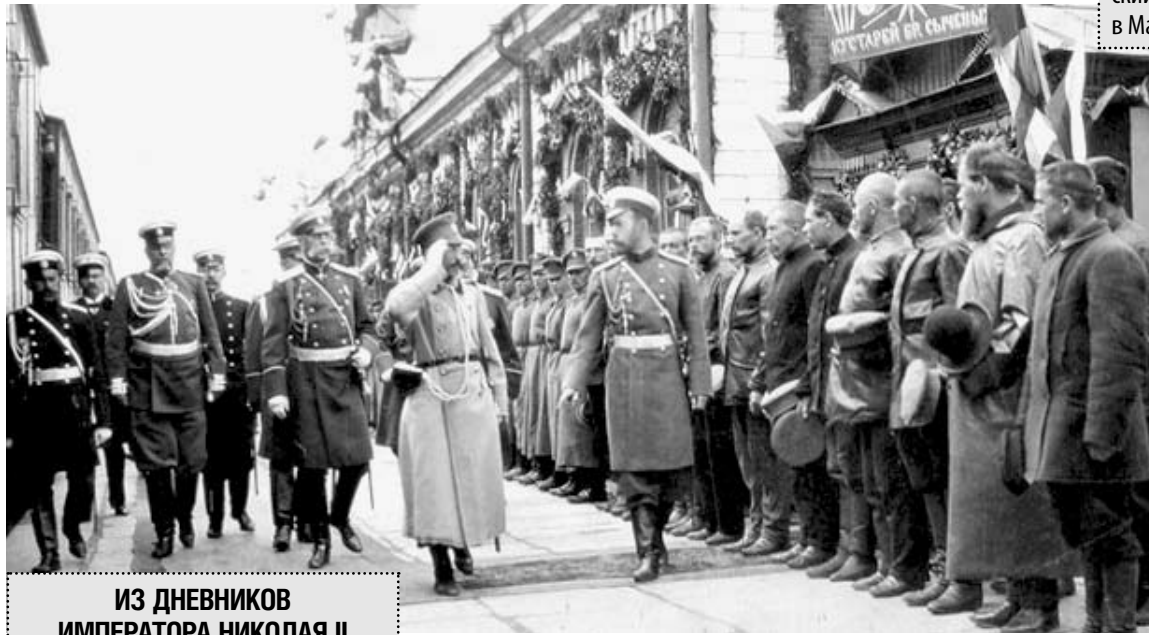
Визит императора в Златоуст, 1904 год. Смотри 214-го Мокшанского и 282-го Черноярского пехотного полков.

тием настолько исключительным, что люди верили: жизнь изменится к лучшему. Да и сам Николай Александрович слышал просьбы народа. Так, в поселке Крутоярском (ныне в Октябрьском районе) казаки рассказали ему о великой беде — пожар уничтожил 150 домов, десятки людей оказались без крова. Погорельцам пожаловали 600 рублей. «Радости казаков не было конца, и со слезами благодарности за великую милость проводжали они далеко за поселок