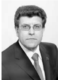
Александр Журавлев, заместитель председателя Законодательного Собрания Челябинской области, председатель комитета по социальной и молодежной политике, культуре и спорту Александр Журавлев (фракция «Единая Россия»):

— Один из важнейших вопросов, которые затронули депутаты на заседании комитета по социальной и молодежной политике, культуре и спорту, — это реализация программы модернизации здравоохранения в Челябинской области. Он волнует всех и каждого, и прежде всего самих работников здравоохранения.