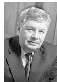
Владимир МЯКУШ, председатель Законодательного Собрания Челябинской области, председатель комитета по бюджету и налогам (фракция «Единая Россия»):

Чтобы иметь возможность еще раз обсудить все параметры нового бюджета, поправки и замечания от депутатов, было решено принять законопроект «Об областном бюджете на 2012 год и на плановый период 2013 и 2014 годов» в первом чтении. Но уже в середине декабря парламентарии вернуться к этому вопросу.