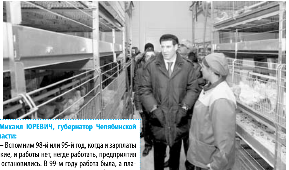
Михаил ЮРЕВИЧ, губернатор Челябинской области:

— Этого в нашей стране не будет, — высказал губернатор свое мнение. — Системный кризис сейчас присутствует в странах, потому что они перекредитованы. Развивающиеся страны стали выпускать то, что раньше делали развитые. Укре-