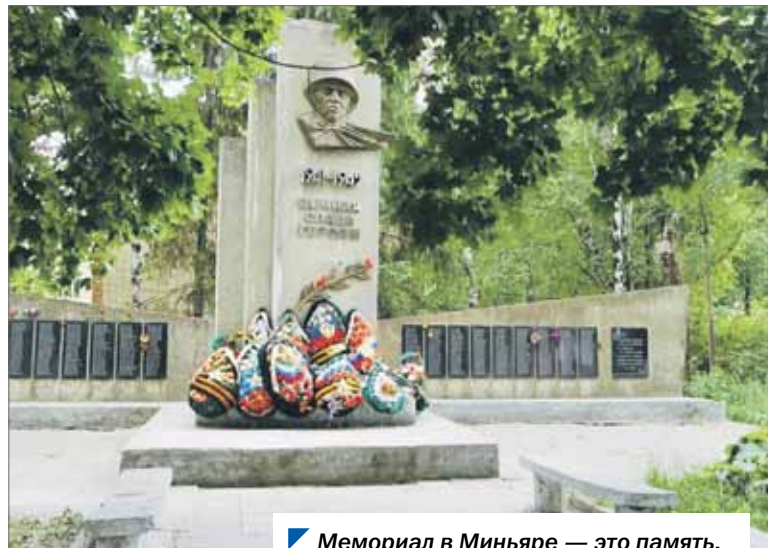
Мемориал в Миньяре — это память, которую нужно сохранить для потомков.