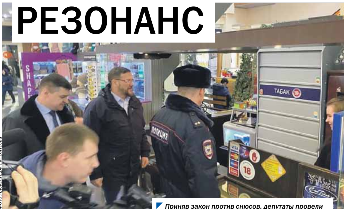
Приняв закон против снюсов, депутаты провели серию рейдов по возможным точкам торговли.