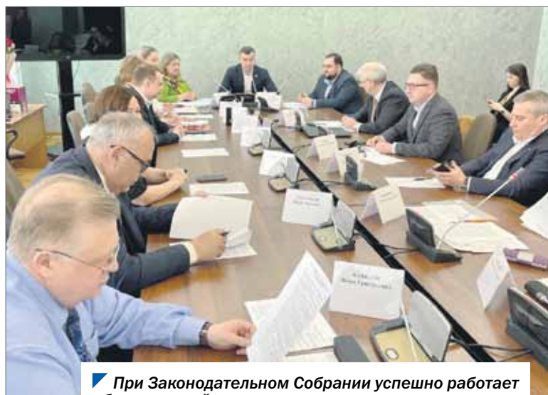
При Законодательном Собрании успешно работает общественный совет по предпринимательству.

С октября 2020 года по сентябрь 2021 года: 19 заседаний комитета проведено; 134 вопроса рассмотрено на заседаниях комитета; 63 законопроекта вынесено на заседание Законодательного Собрания; 13 проектов постановлений подготовлено.