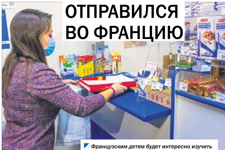
Французским детям будет интересно изучить официальные символы Челябинской области.