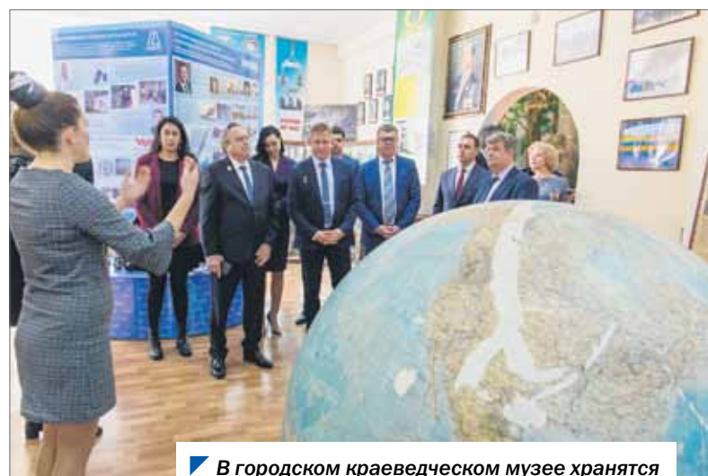
В городском краеведческом музее хранятся уникальные космические экспонаты.