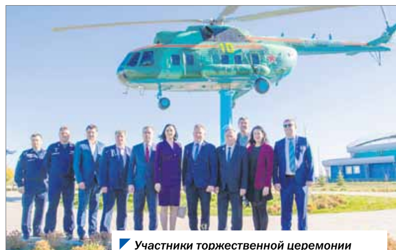
Участники торжественной церемонии посетили сквер «Звездный» в Южноуральске.