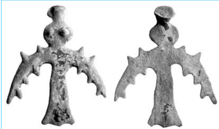
Знаменитые «люди-птицы», бронзовые статуэтки, изготовленные мастерами Иткульской культуры.

Среди известных памятников Иткульской культуры – десятки так называемых «городков мастеров», укрепленных поселений, обнаруженных на севере Челябинской области и в Притоболье, а также, как предполагают ученые, культовый объект Каменные палатки на озере Большие Аллаки.