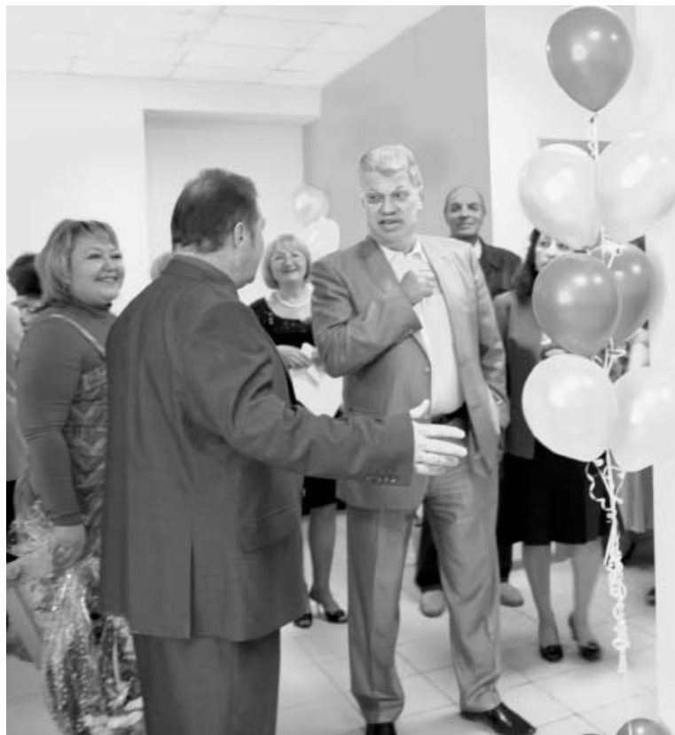
Торжественное открытие фойе школы искусств № 11 после реконструкции.